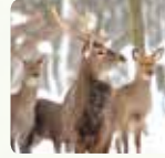
Cerf de Virginie